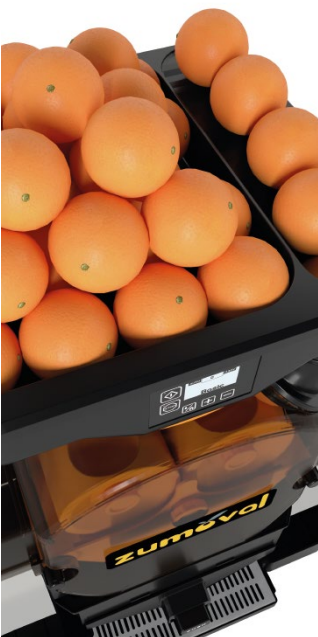
NEW manual feeder NUEVO alimentador manual NOUVEAU chargeur manuel NUOVO alimentatore manuale