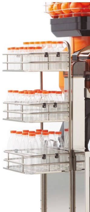
Bottle stand on cabinet Botellero sobre mueble Porte-bouteilles sur meuble Portabottiglie sul mobile