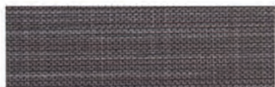
Silex.011 21 011