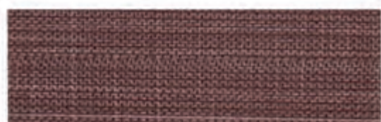
Wenge.011 21 009