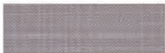
Taupe.011 21 003