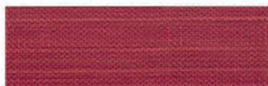
Grenat.011 21 016