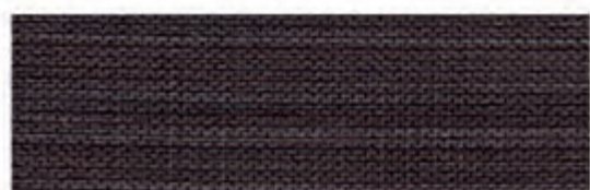
Anthracite.011 21 012