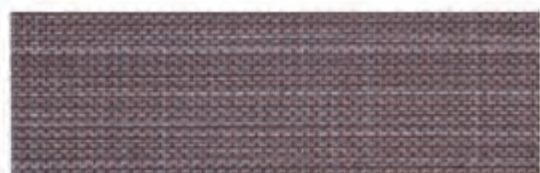
Brun.011 21 008