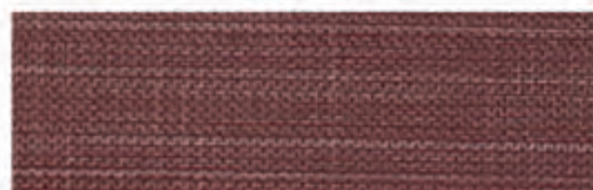
Chocolat.011 21 010